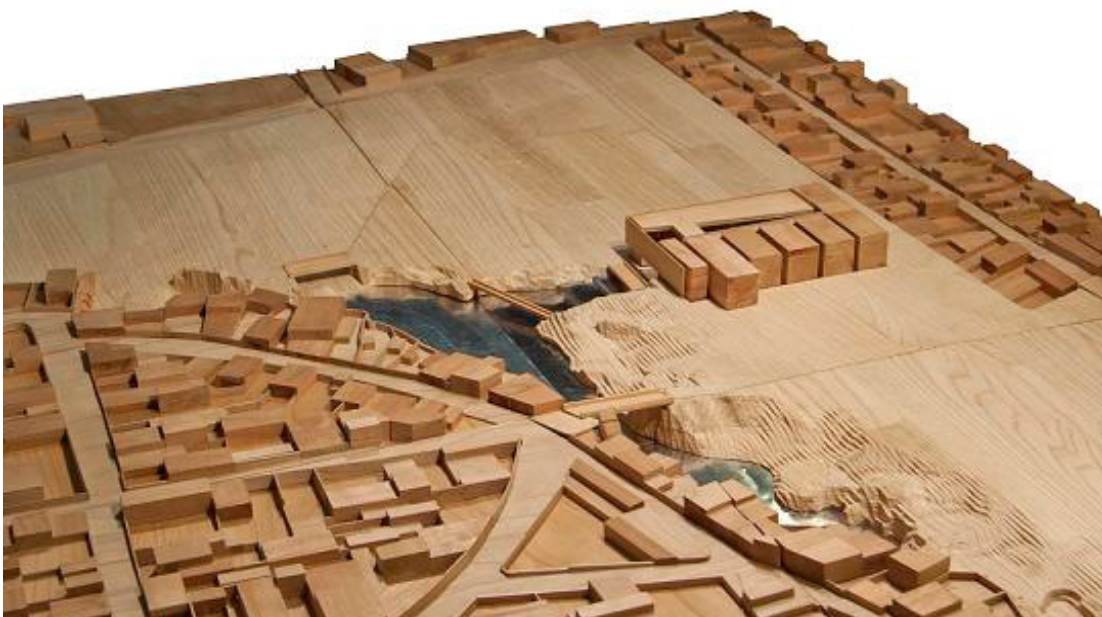
Maqueta: detalle archivo general

madera de cerezo y castaño, 100 x 150 cm aprox