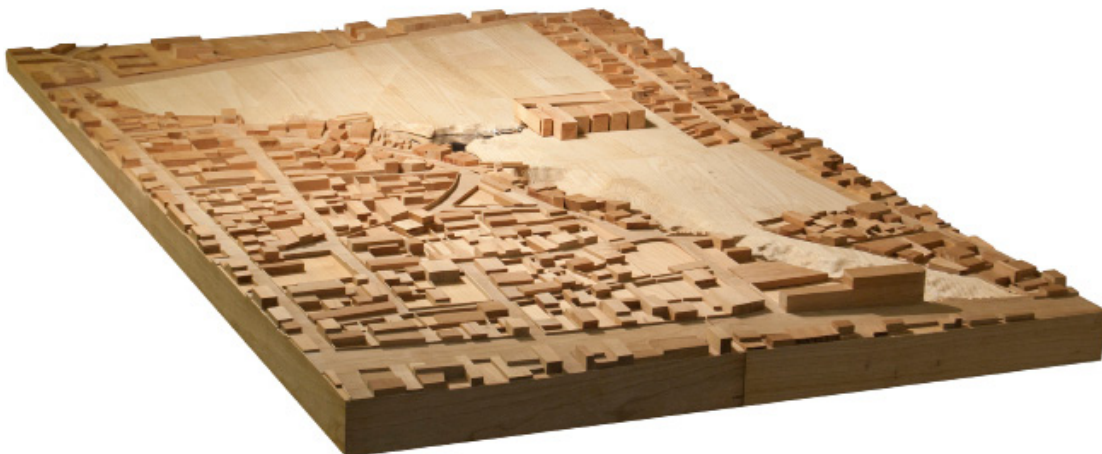
Maqueta: detalle archivo general madera de cerezo y castaño, 100 x 150 cm aprox