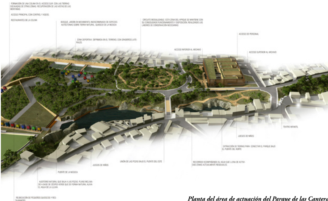
Planta del área de actuación del Parque de las Canteras

En la zona del estadio que será derribado se construirán pistas deportivas, se plantará gran cantidad de vegetación y se preparará la instalación de un recinto ferial de pequeña escala.