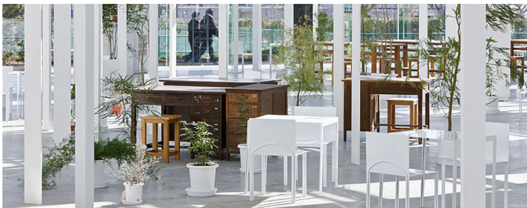
Kanagawa Institute of Technology, 2005 - 2007